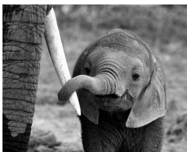
Graphique 1 : Nudge éléphantesque

Comme le dit Richard Thaler, l'homo sapiens n'a ni « le cerveau d'Einstein, ni les capacités de mémorisation du Big Blue d'IBM, ni la volonté de Mahatma Gandhi ».