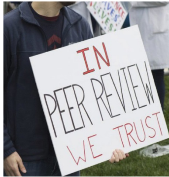
Nos militants en action

L'économie est-elle une science ? Une des principales caractéristiques de la « science » est son aspect cumulatif. Les nouveaux savoirs scientifiques ne viennent pas remplacer les précédents, ils les complètent, et les approfondissent en montrant leurs limites. Ceci est vrai pour les grands paradigmes comme pour les petites avancées quotidiennes. Quand un nouveau paradigme devient dominant en science, les précédents ne sont pas annihilés mais incorporés, généralement au titre de version simplifiée ou de cas particulier, dans le nouveau. Plus régulièrement, dans le travail quotidien des scientifiques